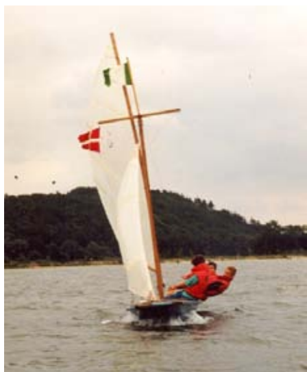
P520 ostravského 8. oddílu VS

Flint a Sam propagují profesio-nálně vyráběné stěžně s drážkou a dacronové plachty.