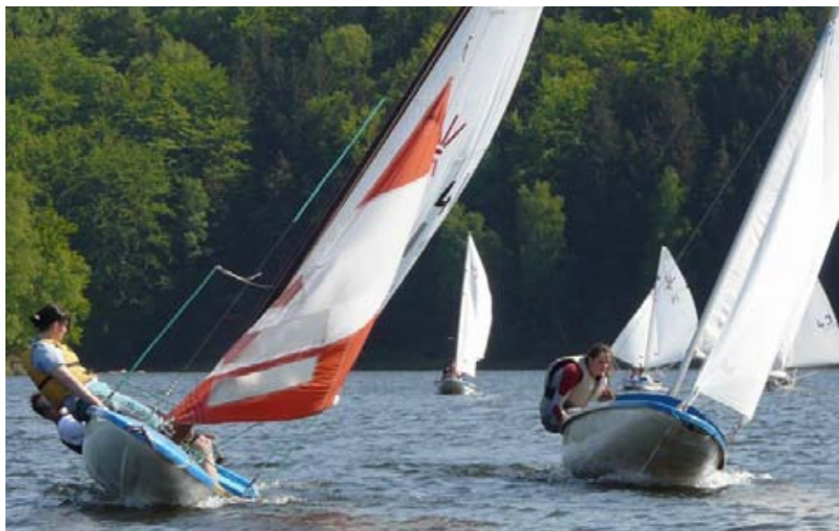
Závod oplachtěných pramic

trupů P550E se úspěšně představil na SKARE 2009. Také Mao překvapil dvoustěžníkem, který připravil na NAVIGAMUS 2009.