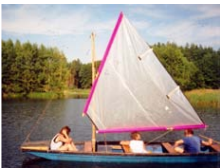
Pramice P520, oplachtění Luger 5 m 2

Na jedné pramici již vybavené ploutvovou skříní byla odzkoušena takeláž s šalupovým oplachtěním z kaširovaného polyetylenu 5 m 2 , což byl vývojový krok k oplachtěným pramicím P520.