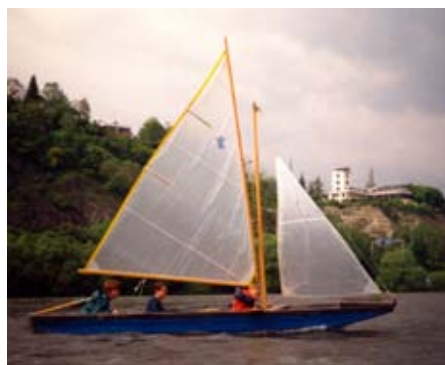
Pramice P520, oplachtění Scout 7 m 2

Zájem o aktivní účast v závodech byl velký. A pak už šly události mílovými kroky. Pro uspořádání příštích jachtařských závodů nabídli Pardubičáci ze 7. přístavu svoji vodáckou základnu na Seči.