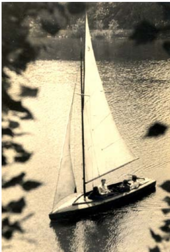
Kajutová plachetnice Vorvaň