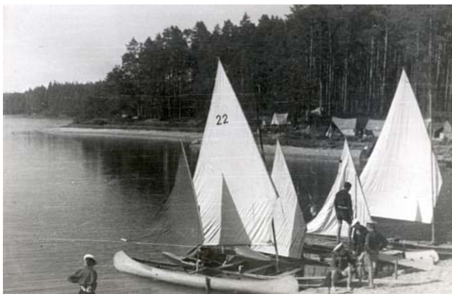
Plachetnice na táboře nymburské Modré flotily, Staňkov 1946.

Na jaře 1945 zahájil svou činnost 2. přístav vodních skautů Modrá Flotila Nymburk. Využily se tesařské zkušenosti a posádky a družiny si postavily dřevěné pramice.