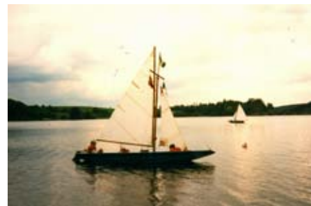
P520 na Seči

Děda nabídl, že dále každoročně první květnovou neděli bude základna na Seči připravena na pořádání celostátní soutěže SKARE. Tak se zrodila Mekka českého skautského jachtingu.