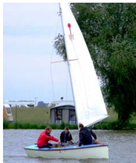
Severka na Navigamu 2009

schválen na podzimním semináři K+K v roce 2003 a HKVS podal na ústředí Junáka žádost o dotaci na stavbu 8 lodí. Obrazovou přílohu a technickou dokumentaci zpracoval Sam, řešením technického pro-