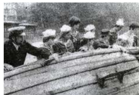
Liberecká pramice s pevnou kovovou ploutví, repro z dobového tisku, 1978

Se čtyřmi oplachtěnými pramicemi uspořádaly liberecké přístavy na Orlíku závod o Modrou stuhu.