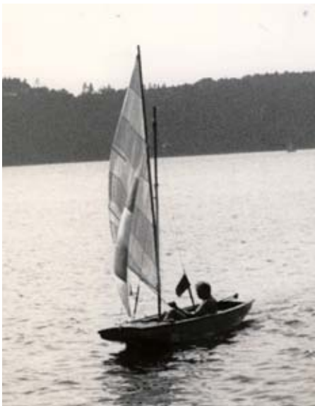
Oplachtěná pramice P450

V té době jsme experimentovali s nymburským turistickým oddílem s malými pramicemi P450, které již byly řešeny v kombinaci sklolaminátové skořepiny s vestavěnou dřevěnou kostrou.