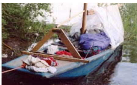
Bivakování na P520

Poslední Efendiho novinka, dvou-stěžník ketový KETCH (čti: keč) s oplachtěním 9 m 2 , postavený na