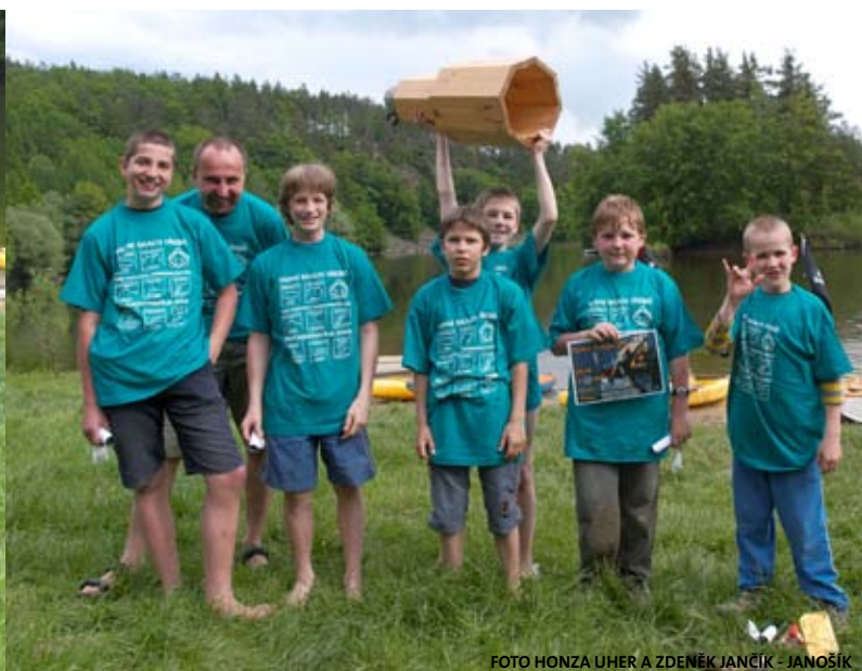
JANOŠÍK