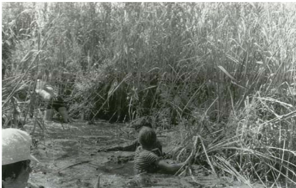
Hledání špuntu na jezeře Bizam

Druhá rovina jsou lidi. Kromě našich kluků to byli Lipovani, kteří na nás byli milí. Dokonce mne jedna babka na trhu upozornila: „Haló, mladý pane, zavřte si tu brašnu, to víte, jste v Rumunsku a tady se krade.“ Nevím, jak moc se tam kradlo, jinou zkušenost jsme tam nezískali. A potom ti kluci - od největšího (mého zástupce Racka), po nejmenšího Štíška. Když už se tu a tam náhodou někomu něco stalo, ostatní se o něj postarali, velcí pomáhali malým, malí velkým plně důvěřovali.