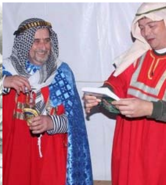
Vezír během Expedice Delta a Vezír o 25 let později při křtu knihy.