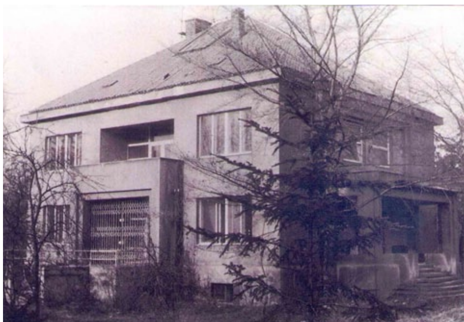
Historická fotografie nymburské Tortugy.