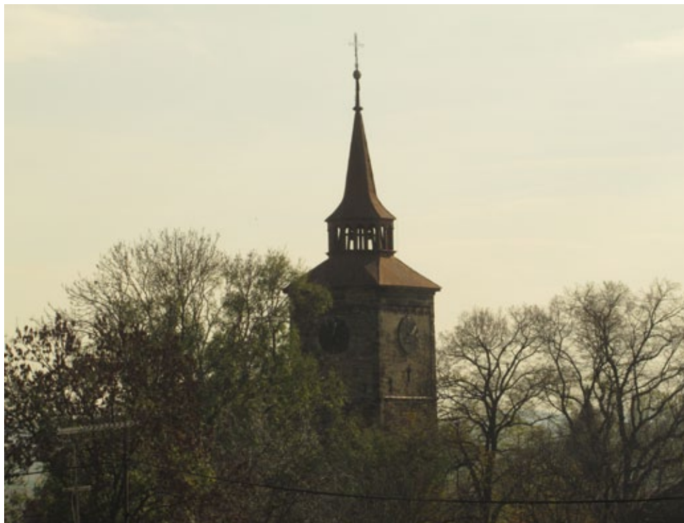
FOTIA N TĚTO STRANĚ MILAN NĚMEC - STOPAŘ

Na webu HKVS bude zprovozněna galerie fotografií a videí pro vybrané fotografie z větších akcí. Na oslavy 100 let vodního skautingu se připravuje logo, dále je možné zapojení se do aktivit v rámci projektu Skautské století. Pro Navigamus 2012 je zřízena doména navigamus2012.skauting.cz. Komise doporučuje zřídit doménu www.navigamus.cz, která by sloužila jako centrální úložiště dat o všech ročnících Navigamu a zároveň jako pomoc pro organizaci dalších ročníků.