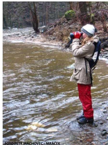
MRÁČEK

Cesty vedou kolem řeky a není to procházka po vyšlapané cestičce. Mnohdy obcházíme objekty a místa, kde nejde projít i několik stovek metrů, padáme ze strání, vyhýbáme se silničnímu provozu. Počasí hraje také velkou roli. V letech, kdy je opravdová zima, je vodní plocha v celkovém ledovém krunýři a ptáci jsou jen velmi vyjímečně spatřeny u výtoků z továren a jezových propustí. Letos byla řeka volná, a tak bylo užasné pozorovat skorce a jejich neúnavné mizení do ledové vody za potravou. Volavky nehnutě stojící na stromech při vodě a při porušení pomyslné bezpečnostní vzdálenosti odlétající do bezpečí. Ledňáčka čekajícího na nepatrný