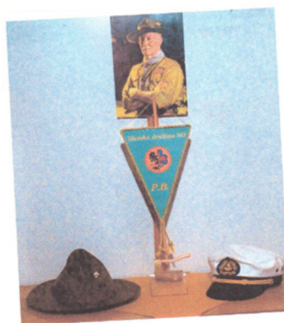
PF 2013 Slezská družina SC