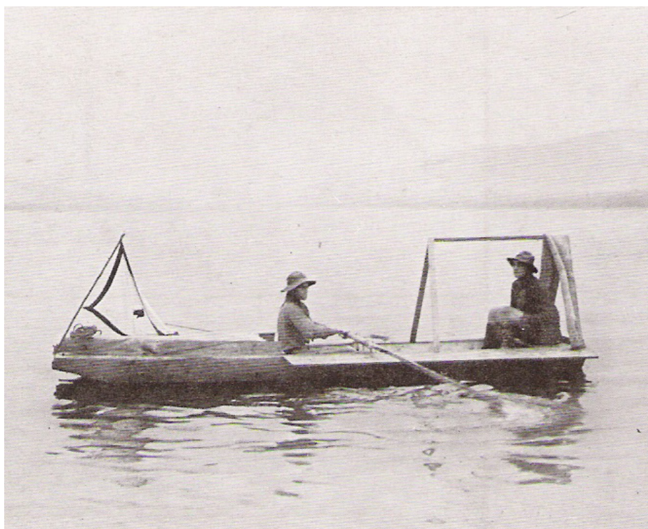
Foto z pohlednice s pramicí, která vyšla na podzim 1913.

Po skončení tábora se trojice nejodvážnějších vydala na více než sto kilometrů dlouhou plavbu do Prahy a zapsala se tak navždy do galerie prvních vodních skautů. Do deníku si tehdy zapsali: „Večer skláněl se nad tichou, hlubokou